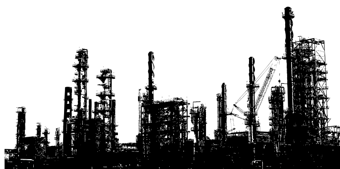
Desarrollo e industrialización es igual a consumo.