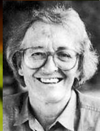
Elizabeth Kubler Ross

Morir es mudarse de una casa a otra mucho más bella.